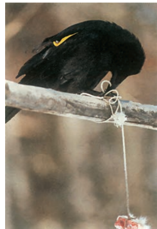
شکل ۷- حل مسئله در کلاغ: کلاغ با جمع کردن نخ تکه گوشت را بالا می‌کشد.

رفتارشناسان حل مسئله جانوران را در محیط طبیعی نیز بررسی کرده‌اند. شامپانزه‌ها برگ‌های شاخه نازک درختان را جدا می‌کنند و آن را درون لانه مورخانه‌ها فرو می‌برند تا مورخانه‌ها را بیرون بیاورند و بخورند. این جانوران از تکه‌های چوب یا سنگ به شکل سندان و چکش استفاده می‌کنند تا پوسته سخت میوه‌ها را بشکنند. کلاغ سیاهی که در شکل ۷ می‌بینید، کشف کرده است که چگونه تکه گوشت آویزان به انتهای نخ را به دست آورد. جانور هر بار بخشی از نخ را با منقار خود بالا می‌کشد و پنجه پای خود را روی آن قرار داده و سرانجام به گوشت دست پیدا می‌کند.