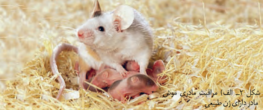
شکل ۲- الف) مراقبت مادری موش مادر دارای ژن طبیعی