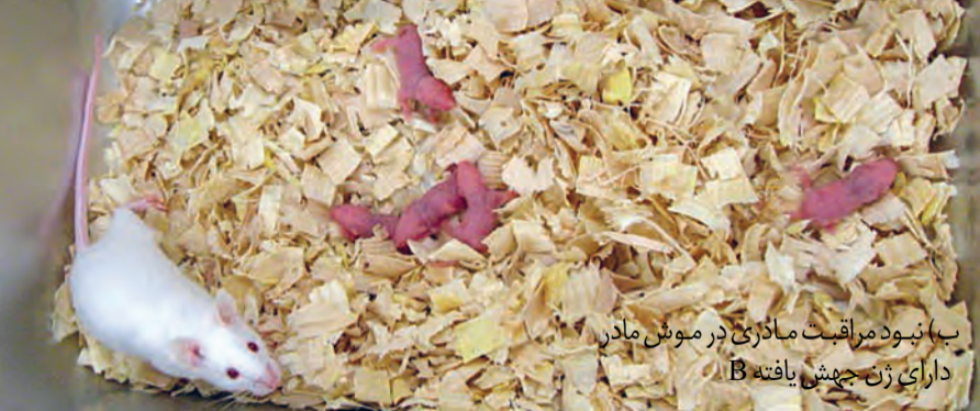
ب) نبود مراقبت مادری در موش مادر دارای ژن جهش یافته B