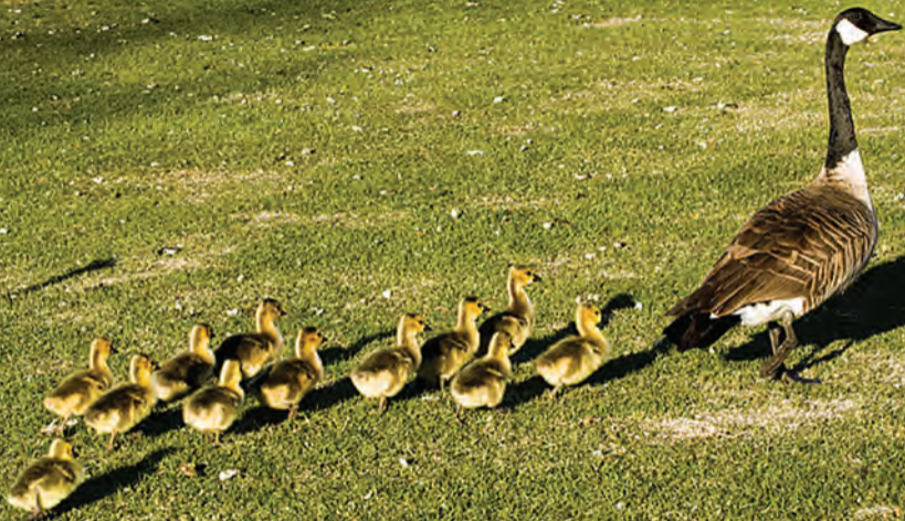
شکل ۸ نقشه‌یابی جوجه غازها نسبت به مادر خود