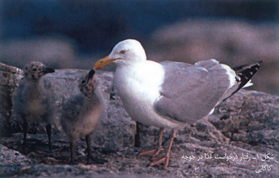
شکل ۱- رفتار درخواست غذا در جوجه کاکایی